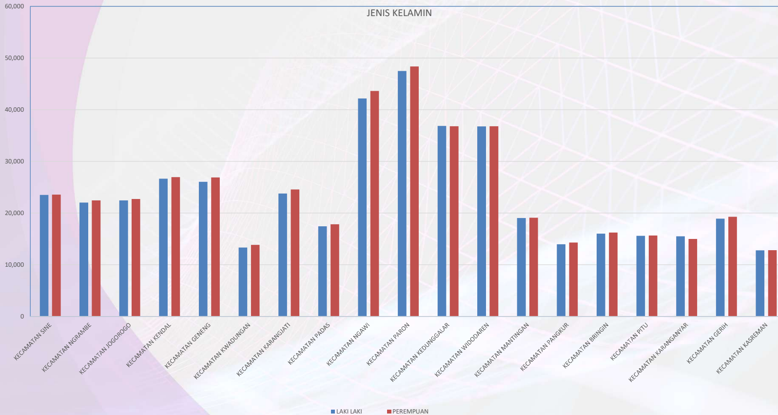
DIAGRAM PENDUDUK BERDASARKAN JENIS KELAMIN